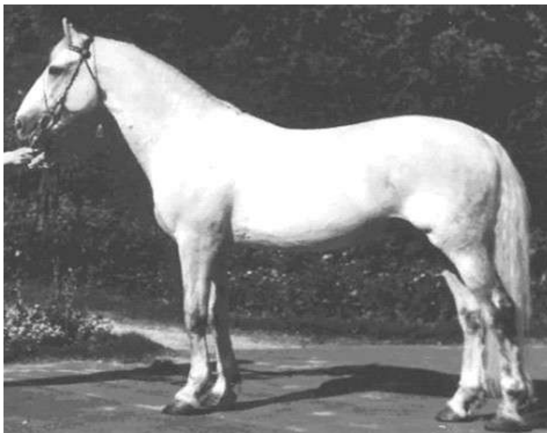
Жеребец Отклик 1952 г.р. (Отбой-Конвенция)