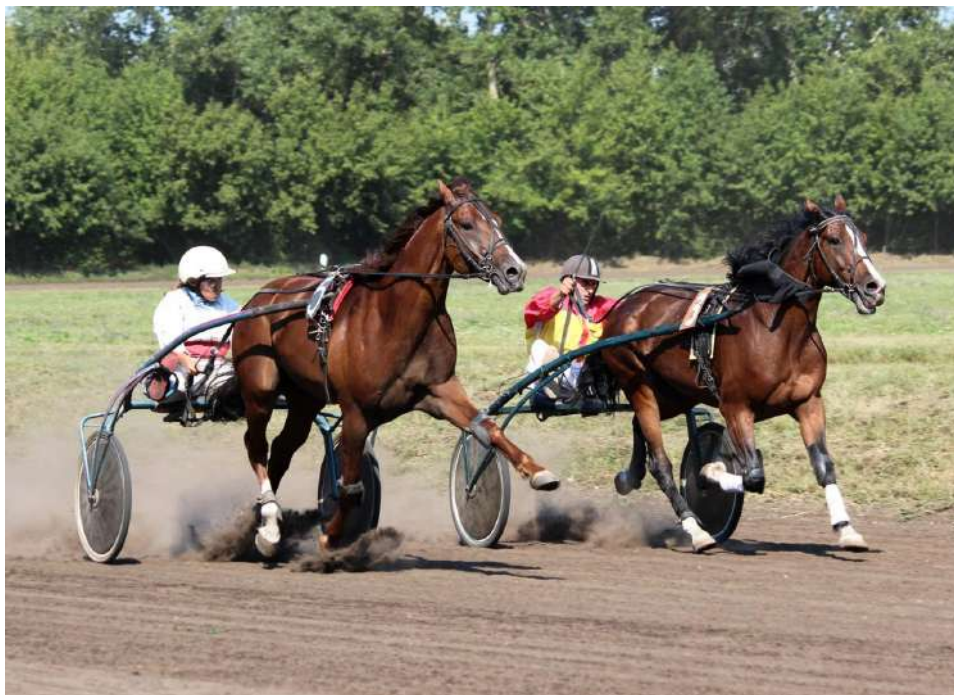
Курский ипподром 2014г. Кофеин и Натиск