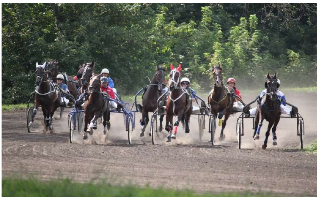
Старт приза Элиты на Курском ипподроме, 2016г.