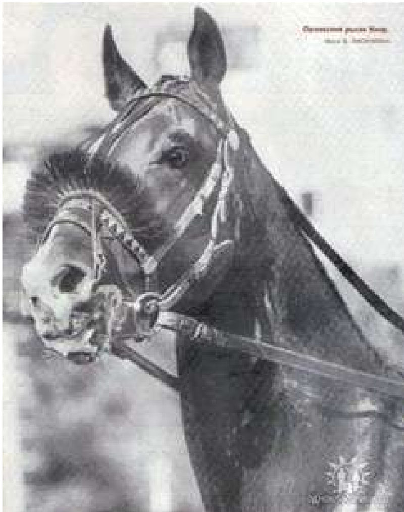
Жеребец Кипр (Помпей-Крутизна) (1982-2009)