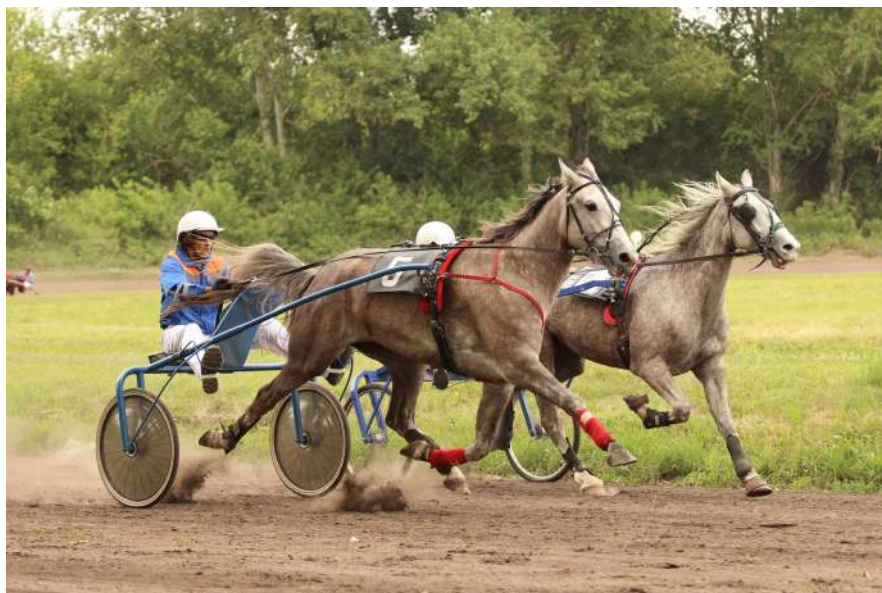
Победительница Приза Кипра 2022г. Комбинация (Барон-Кобра)