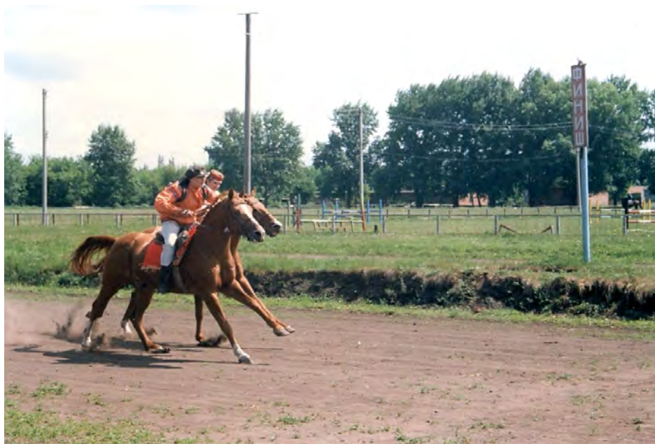
На фото лошади Курской ГЗК с ипподромом

Оценивают также внешний вид: костюмы всадников, снаряжение и экстерьер лошадей.