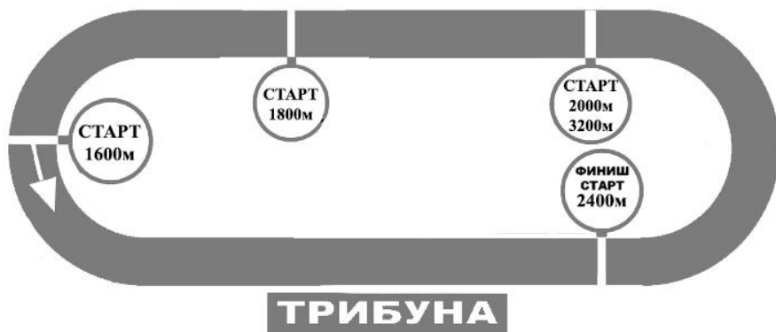
СХЕМА РАЗМЕТКИ И РАСПОЛОЖЕНИЕ СТАРТОВЫХ И ЧЕТВЕРТНЫХ ОТРЕЗКОВ НА ПРИЗОВОЙ ДОРОЖКЕ ТАМБОВСКОГО ИППОДРОМА