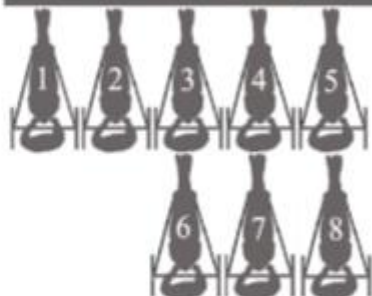
СХЕМА ДВИЖЕНИЯ ЛОШАДЕЙ НА ДОРОЖКЕ ИППОДРОМА ВНУТРЕННЯЯ БРОВКА