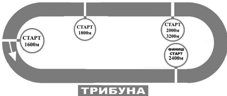
СХЕМА РАЗМЕТКИ И РАСПОЛОЖЕНИЕ СТАРТОВЫХ И ЧЕТВЕРТНЫХ ОТРЕЗКОВ НА ПРИЗОВОЙ ДОРОЖКЕ ТАМБОВСКОГО ИППОДРОМА